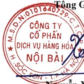
Nguyễn Xuân Phúc